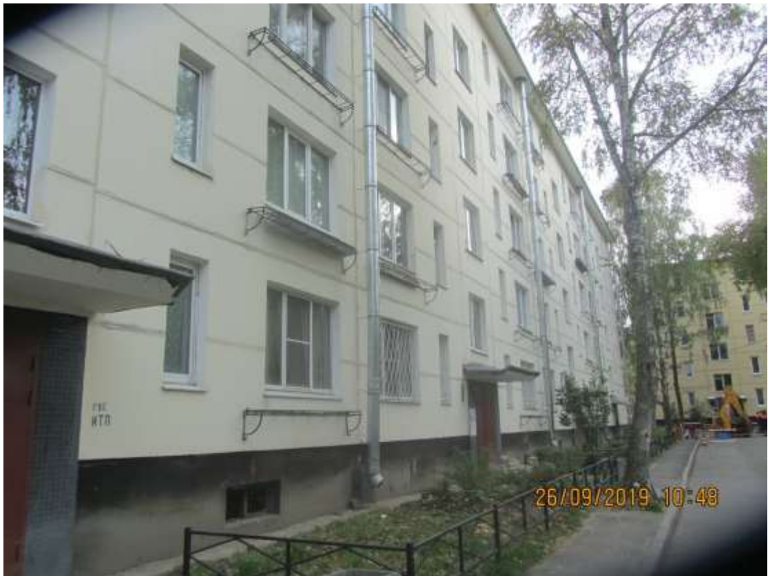
ул. Красногородская, д. 13 – герметизация межпанельных швов.