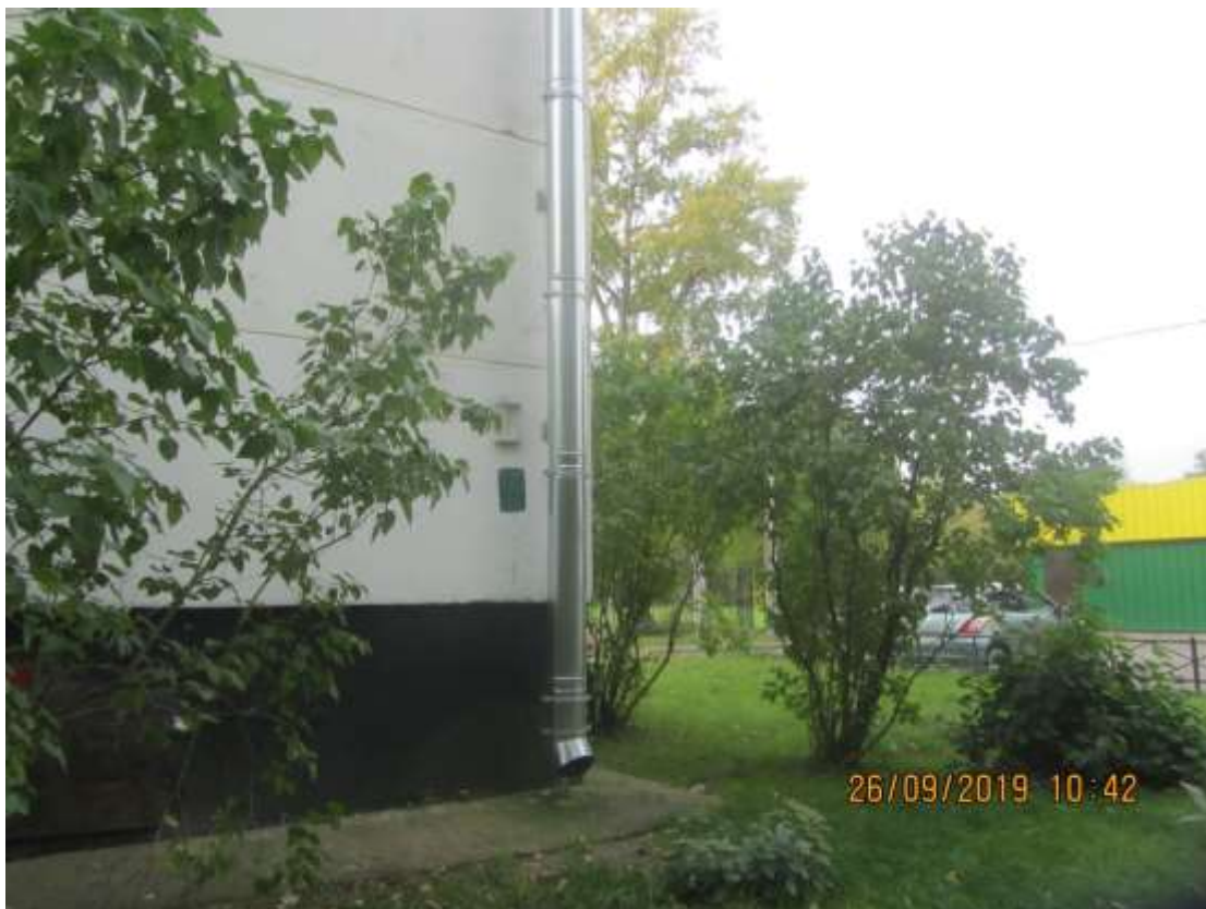
Красносельское шоссе, д. 40 – система водоотведения.