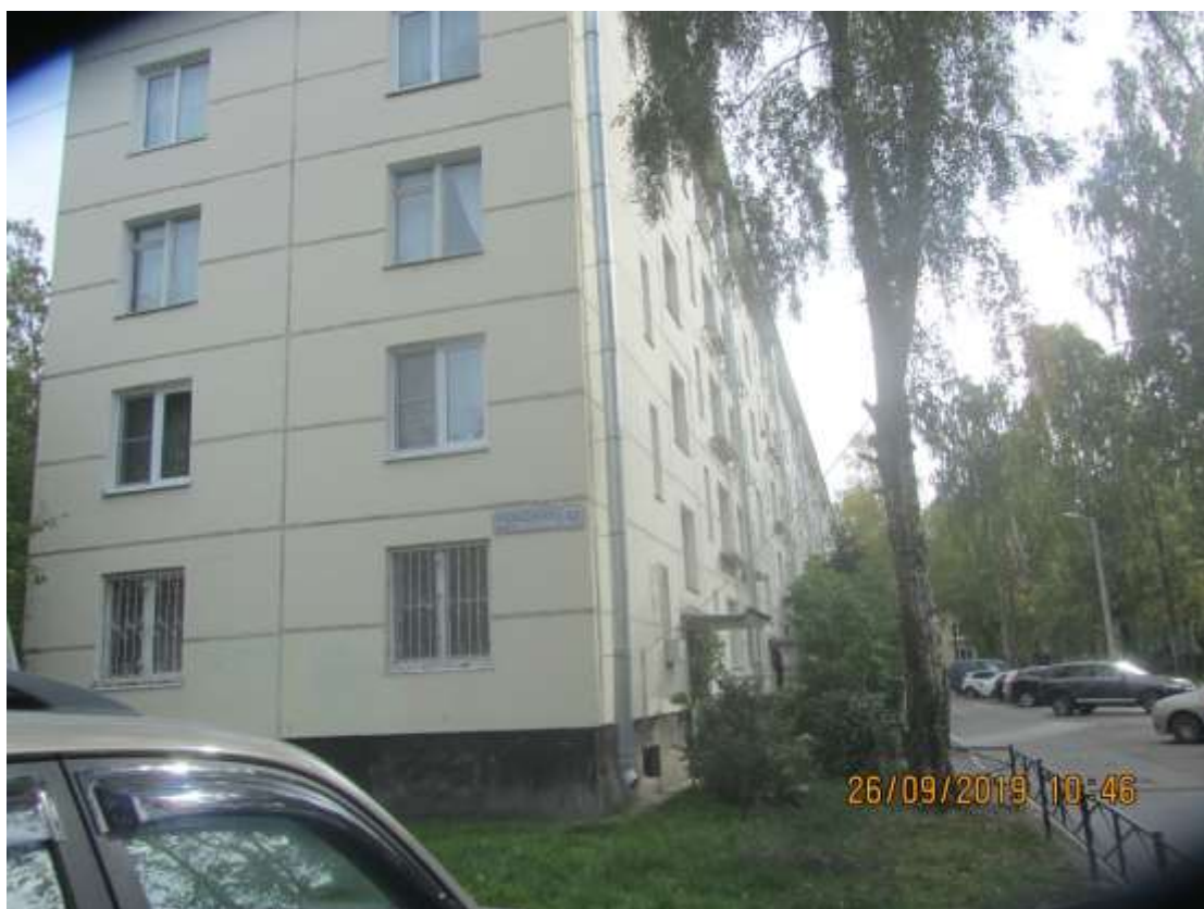
Красносельское шоссе, д.38 – система воотведения.